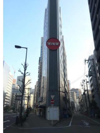
江戸堀 2 1