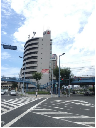
福島 4 5