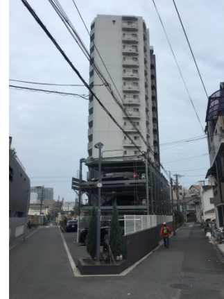
都島本通 2 5