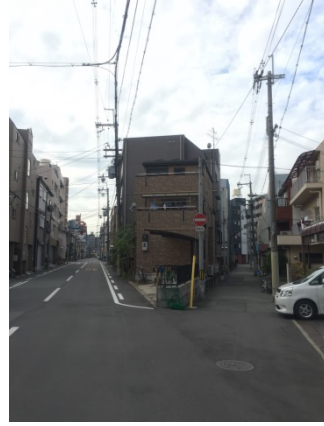
十三東 2 2