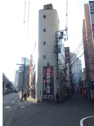
難波中 2 7