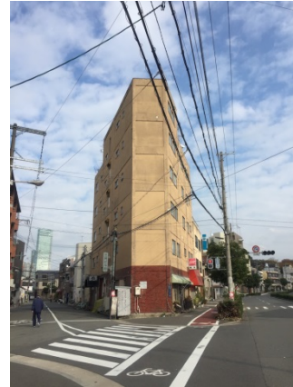
聖天下 2 2