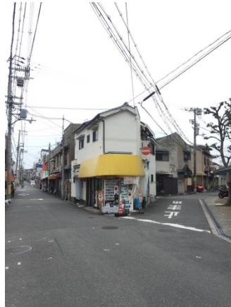
相生通 4 5