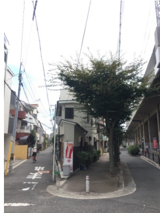
東粉浜 2 1