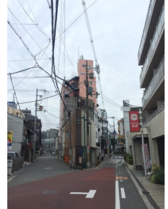
森小路 2 5