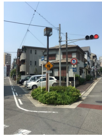
真法院町 4 7