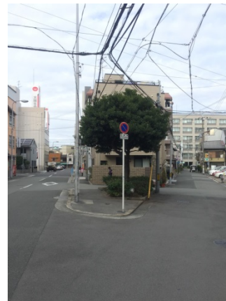
十三東 2 5