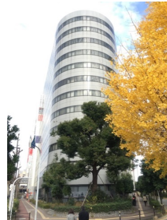
新大阪 3 0