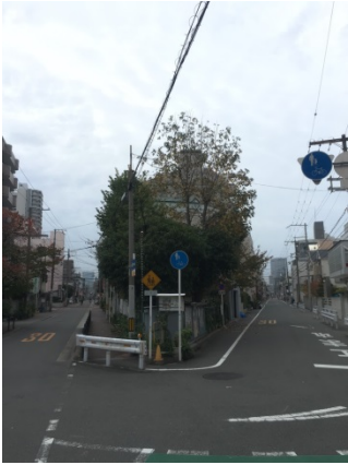
高倉町 2 2