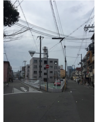
都島北通 3 0