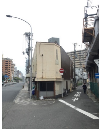
中崎町 3 0