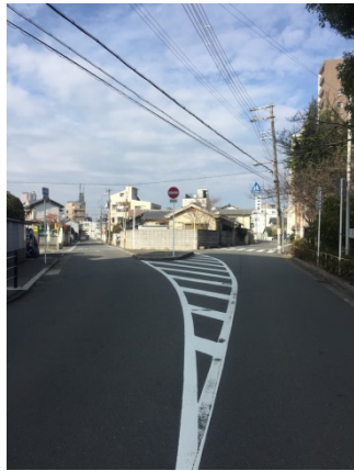
鳴野東 2 5