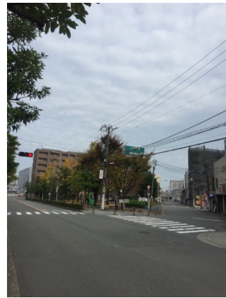
新梅田シティ 3 2