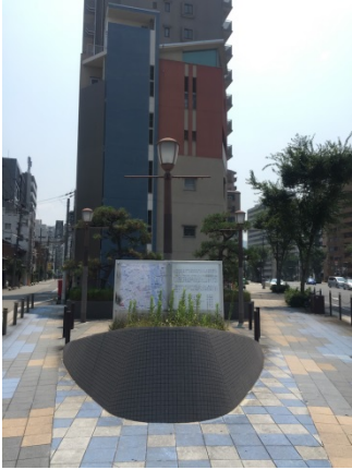
西天満 2 0