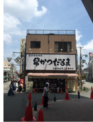
新世界 3 0 ②