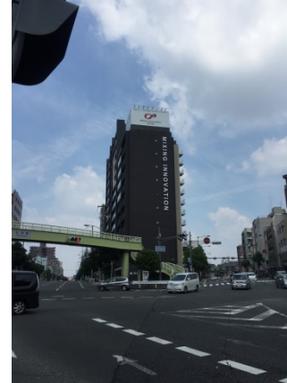
北河堀 2 2