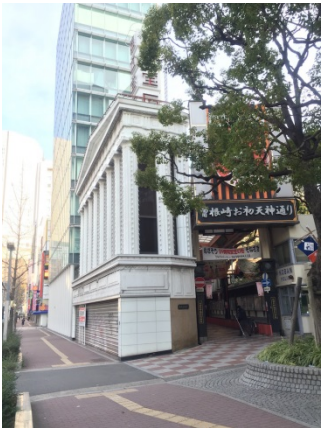
お初天神 2 0