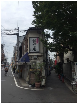
花くじら 2 5