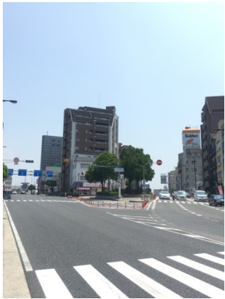
一心寺前 3 1