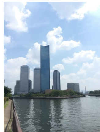
O B P 5 9