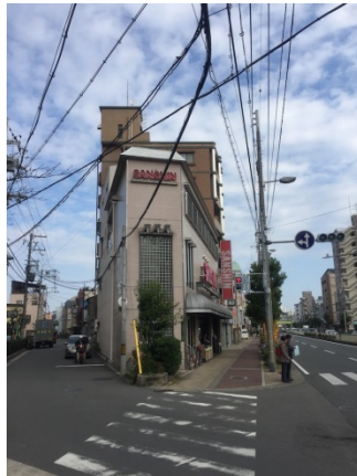
上新庄 2 4