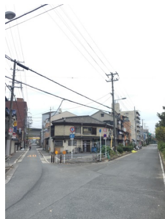
大東町 3 6