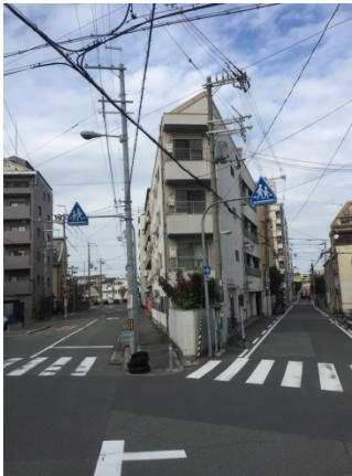
木川東 2 3