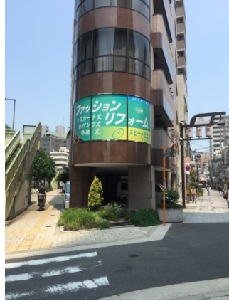
天神橋 3 0