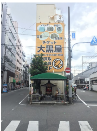
京橋 1 5