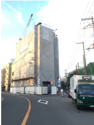
長池 3 5