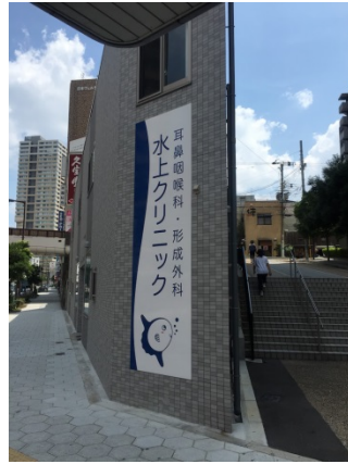
松屋町 2 0