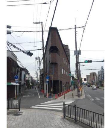
北畠 2 2