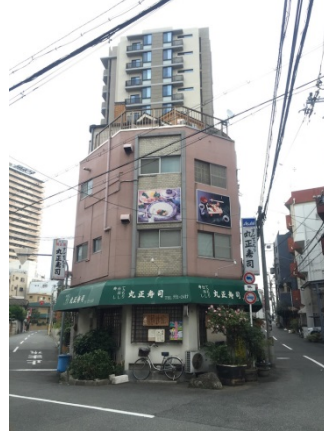
堂ヶ芝 2 5