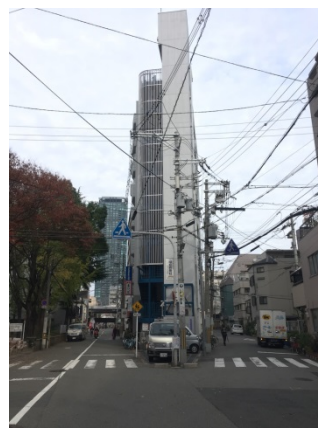
新福島 1 4