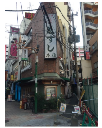
曾根崎 4 9