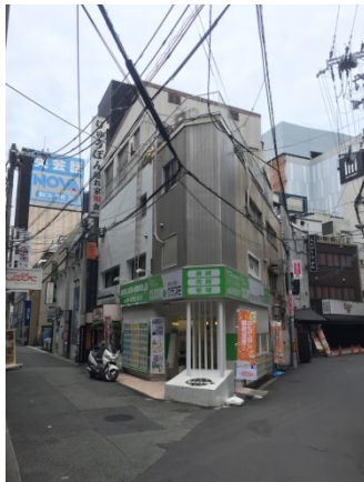
茶屋町 5 0