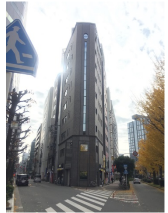
新大阪 3 2