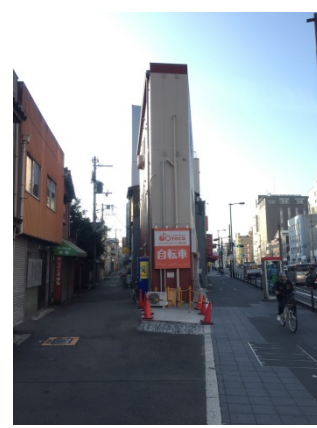
花園南 1 4