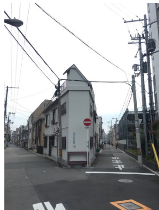
都島本通 2 7