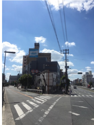
中川一 3 5