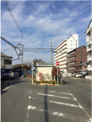
天王田 2 9