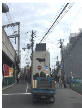
蒲生 1 5