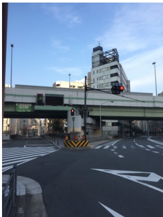
今橋 3 4