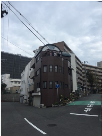
堂ヶ芝 5 0