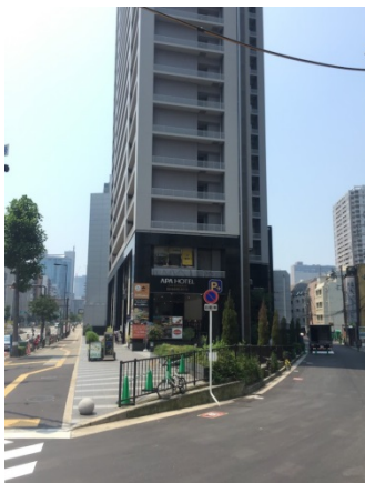
肥後橋 2 7