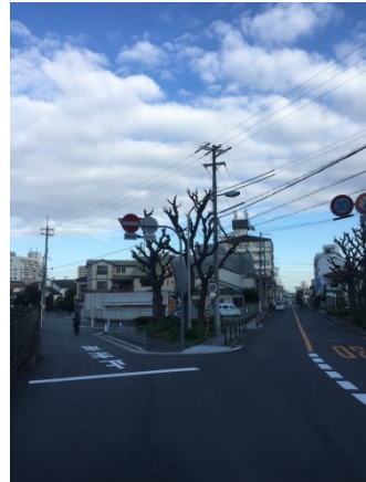
中野 3 0