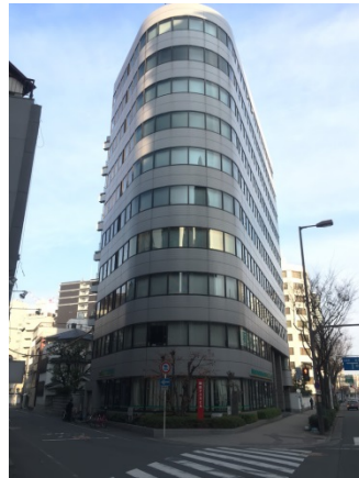
太融寺 4 6