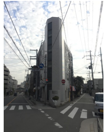
阪南町 3 0