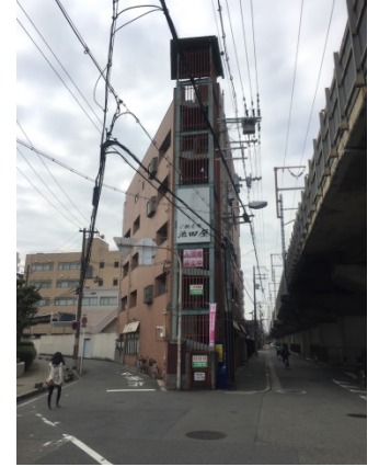
下新庄 2 3