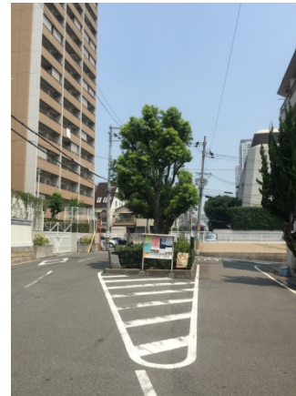
夕陽丘 2 8