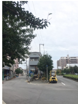
境川 1 5