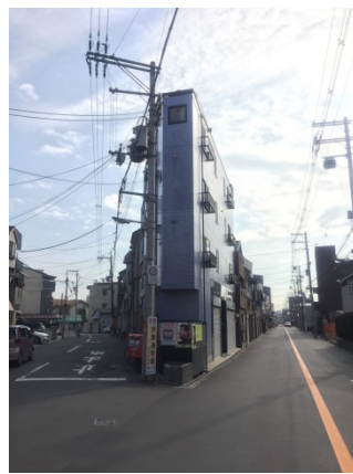
放出 2 5