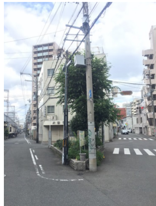
片町 3 2