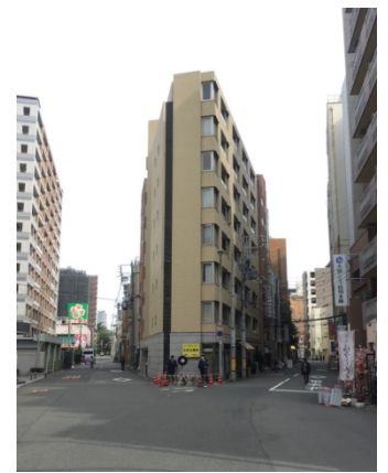
韮本町 2 6