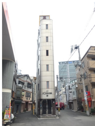
福島 1 3