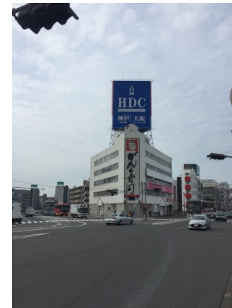
中津 5 4