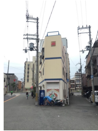
市岡本町 2 0