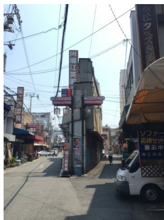
千日前 1 4