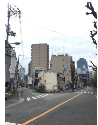
豊崎 3 6