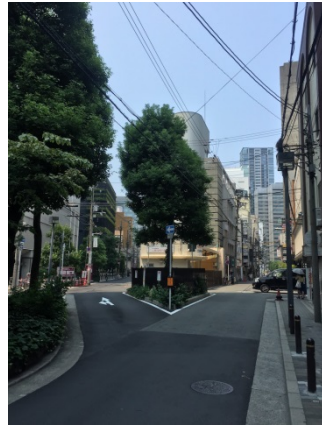
北新地 2 0