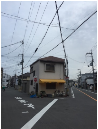
清水 3 0