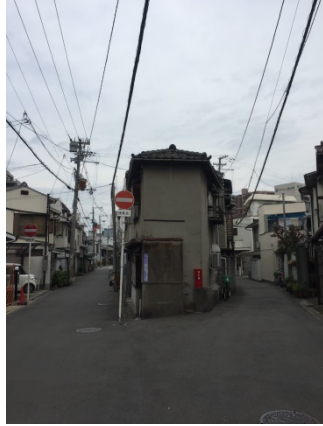
野田 2 2