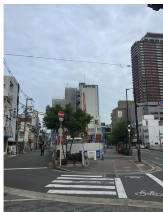
玉造 1 5