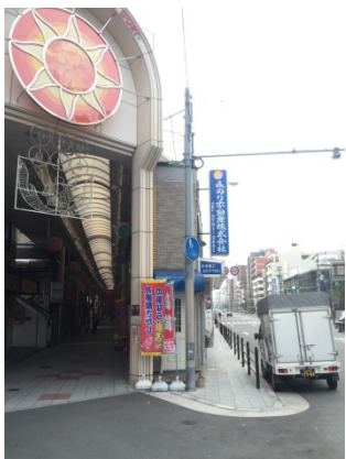
玉造 1 3