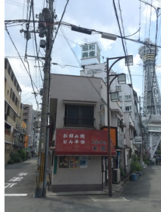
新世界 3 0 ①