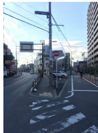
瓜破 1 5