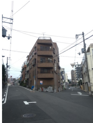
勝山 3 1