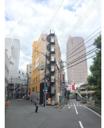
京橋 2 9