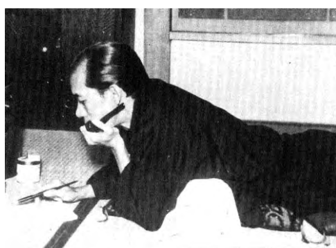
直木三十五全集別巻 (示人社発行) グラビアより

『芸術は短く 貧乏は長し』が彼の文学記念碑(横浜市金沢区 富岡)に刻まれたキャッチコピーである。彼は終生、借金に追われており、机、椅子など持っていればすぐに差し押さえられるので、大概はこのスタイルで執筆した。こうした長年の胸部圧迫が死病となる胸部疾患の誘因となったのかもしれない。