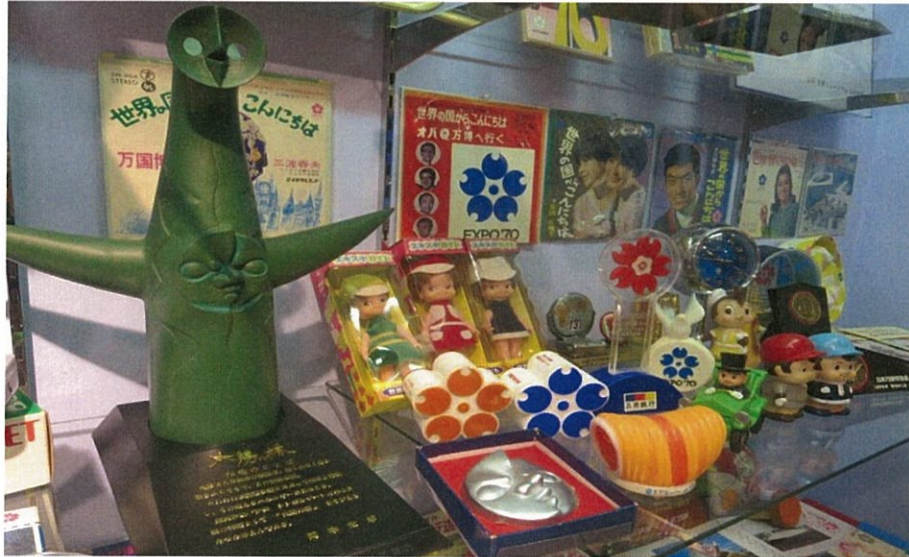
写真：万博ミュージアム展示風景